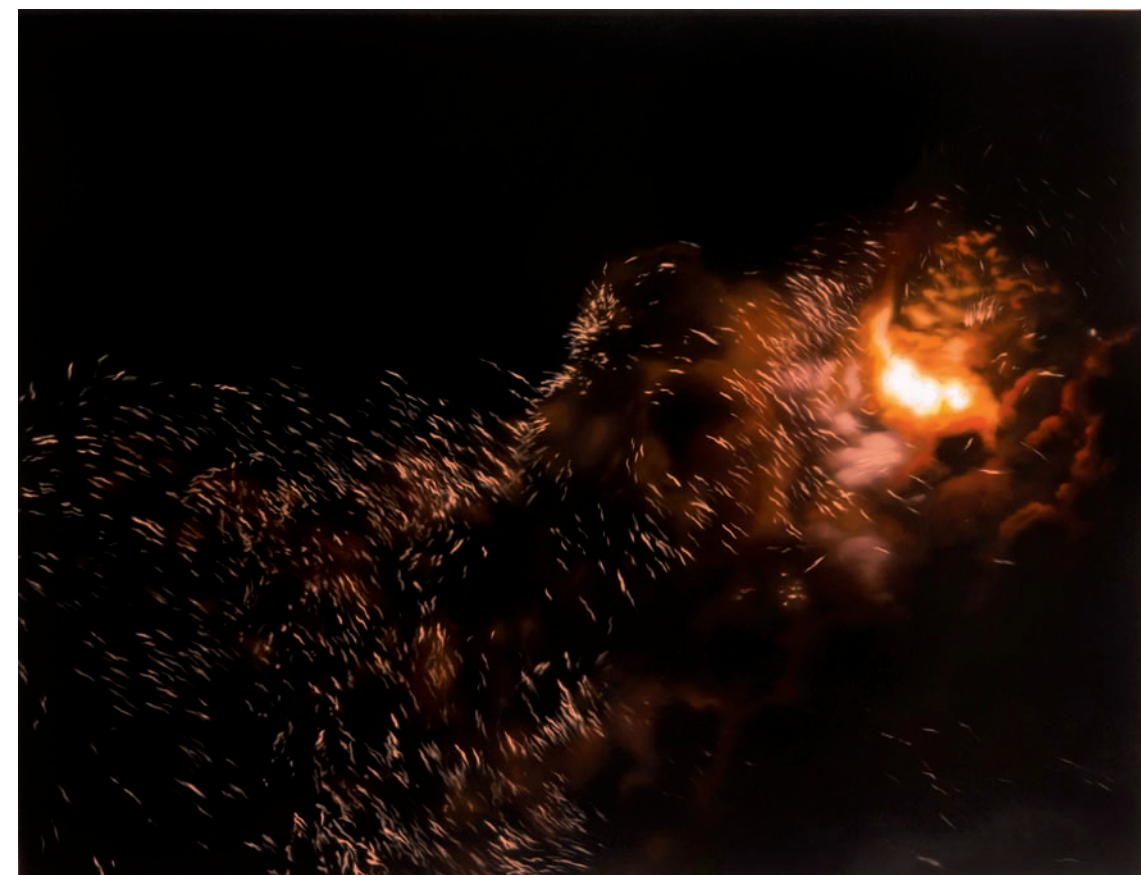
Inaugural Display , 2009. Huile sur toile sur panneau, 114 x 152cm Oil on canvas over panel, 46" x 60"