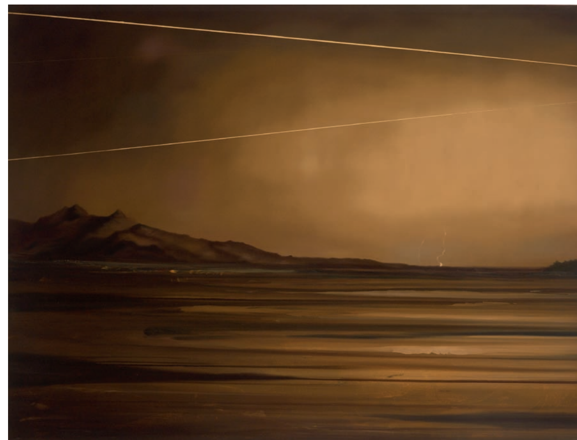
Sub Orbital , 2009. Huile sur toile sur panneau, 114 x 152cm Oil on canvas over panel, 46" x 60"