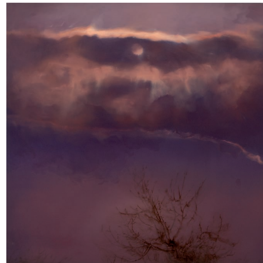
Movement 1 , 2009. Huile sur toile sur panneau, 114 x 114cm Oil on canvas over panel, 46" x 46"