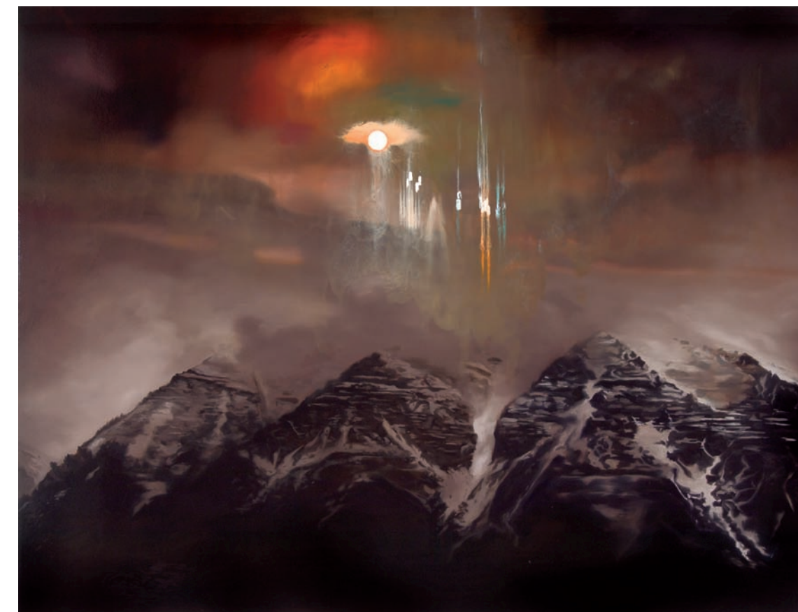
Extrasphere , 2009. Huile sur toile sur panneau, 114 x 152cm Oil on canvas over panel, 46" x 60"